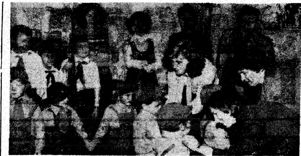
Zilele trecute, în Grădinița nr. 2 cu program prelungit din Petroșeni a avut loc un moment de neuitat: copii din grupa mijlocie au primit cravata de soimi ai patriei.

De pe platforma realizărilor actuale, ne orientăm cu consecvență spre problemele-cheie, tehnice și organizatorice, prin intermediul cărora să asigurăm îndeplinirea integrală a planului pe acest an, respectiv recuperarea și a celor 2000 tone de cărbune restanță. Am depășit planul lucrărilor de pregătire, de la începutul anului, cu peste 150 ml. Ca urmare, vom putea materializa acest deziderat, în primul rând, prin creșterea capacităților de producție. Dispunem, de asemenea, de mari rezerve