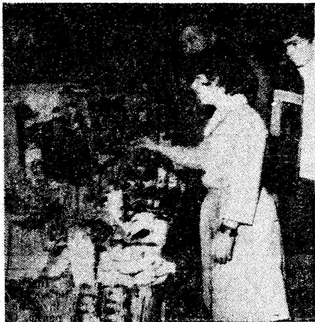
Instantaneu de la expoziția de artă culinară deschisă ieri la restaurantul „Minerul” din Petrosani, de gazdele fazei județene a concursului „Buna servire”.