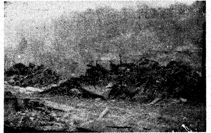
Asemenea mormane de fier vechi — moșire ale unei crase neglijențe gospodărești — pot fi întâlnite în multe locuri din incintele întreprinderilor din Valea Jiului.