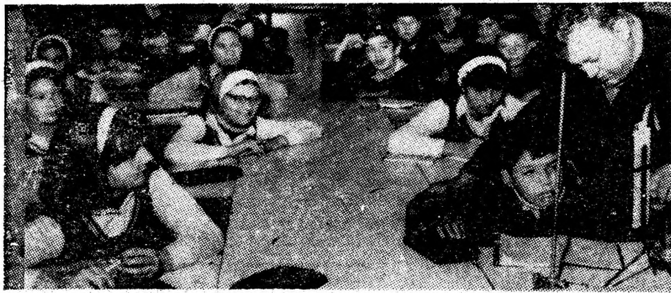
În laboratorului de fizică al Școlii generale nr. 6 Petroșani.