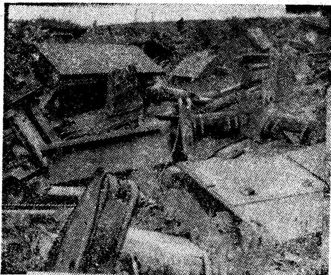
I.M. Vulcan. Ceea ce se vede în cele două imagini alăturate, nu este un loc de depozitare a fierului vechi și nici cel puțin fier vechi nu este, ci... un complex mecanizat, un complex scos din subteran și dezmembrat în piese și subansamble lăsate pradă ruginii. În curînd îl vor acoperi nămeții iernii.

Activitatea de valorificare a resurselor secundare, deși este luna octombrie, se desfășoară în majoritatea unităților economice din Vale încă destul de lent și nu cu suficientă răspundere. În nici o întreprindere vizitată nu se poate vorbi de sortarea și depozitarea, pe calități, a resurselor secundare. Există încă și la ora actuală, în multe întreprinderi, neinventariate, cantități însemnate de fier vechi. Este necesar ca pentru o mai bună desfășurare a acestei activități, factorii de răspundere din fiecare întreprindere, din Combinatul minier Valea Jiului, să inițieze controale, să verifice modul în care sint gospodărite și valorificate resursele secundare.