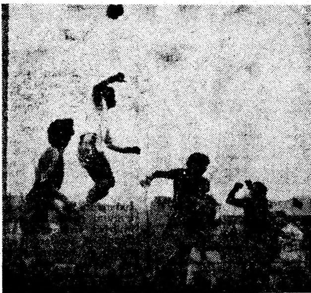
Duel la înălțime însă nu și la înălțimea așteptărilor.