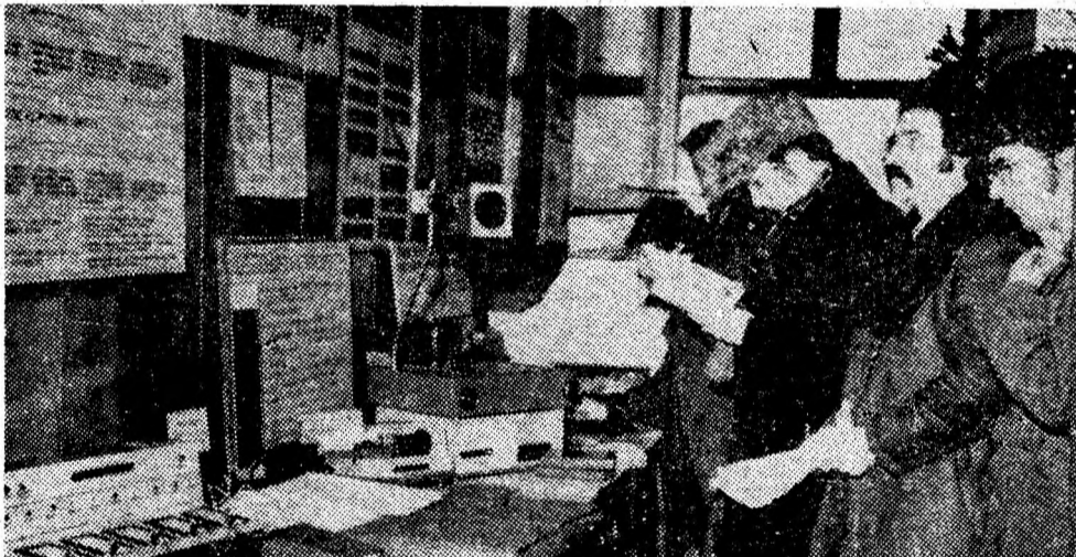
Instantaneu de la expoziția deschisă în holul Casei de cultură din Petroșani cu prilejul fazei municipale a concursului gazetelor de perete, al punctelor de documentare.

RUGBI, campionatul republican de juniori: C.S.S. Petroșani — Grupul școlar Simeria 8—6.