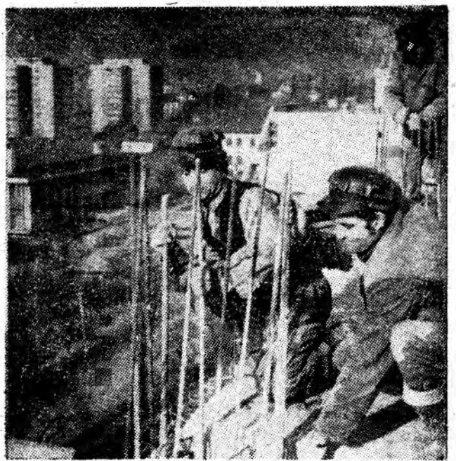
Construcții fixează armăturile pentru planșoul noului etaj al unui bloc din viitorul centru civic al Petroșaniului.

Integrarea cercetării cu producția sarcină de importanță vitală pentru introducerea progresului tehnic