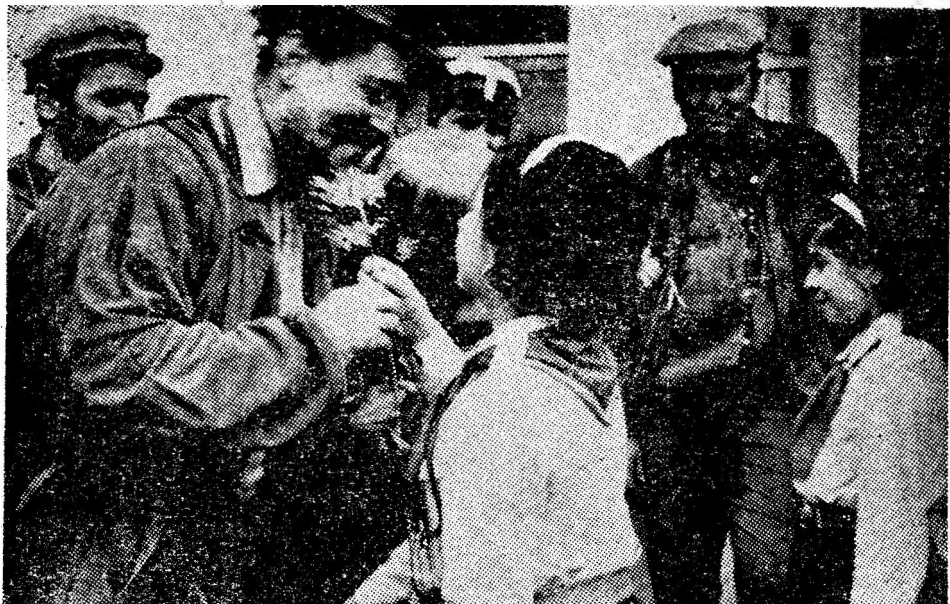
Ieri, pionierii de la Școala generală din Cimpa au venit la mina Lonea să-i felicite pe harnicii mineri de la sectorul IV pentru succesele obținute în cinstea Congresului partidului pe frontul cărbunelui, oferindu-le flori, sărutări și un frumos micorecital artistic.

ÎN PRIMA ZI A CONGRESULUI, ÎN SEMN DE NEȚĂRMURITĂ PREȚUIRE, MINERII DIN VALEA JIULUI ȘI-AU DEPĂȘIT SARCINILE DE PLAN, RAPORTÎND CU MINDRIE: