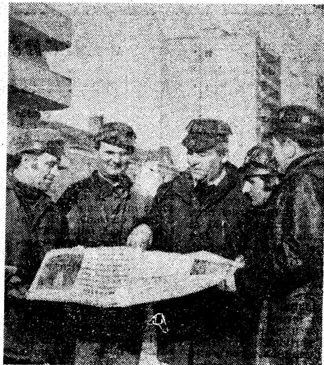
Constructorii de pe șantierul din Petroșani citind cu interes Raportul tovarășului secretar general al partidului.