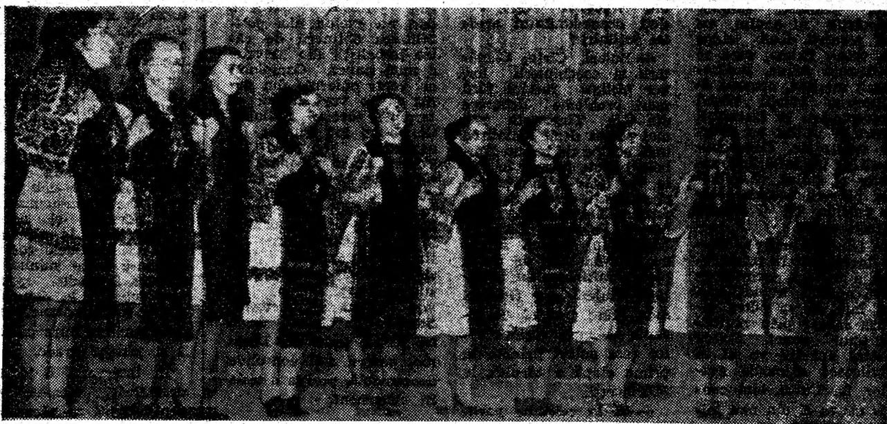
Grupul vocal folcloric de la Cîmpu lui Neag, o formație cunoscută pentru stilul original de interpretare a cîntecelor populare din această pitorească zonă.

Prof. Vasile REPEDU, instructor al Comitetului județean de cultură și educație socialistă