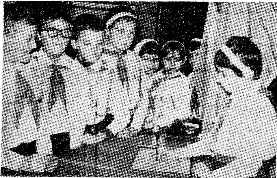
Moment important la Școala generală nr. 5 din orașul Vulcan: primul grup de elevi pionieri frunzași la învățătură semnează legămîntul pionieresc angajîndu-se să-și multiplice strădaniile pentru a-și însuși comorile științei, pentru a deveni pricepuți constructori ai comunismului.