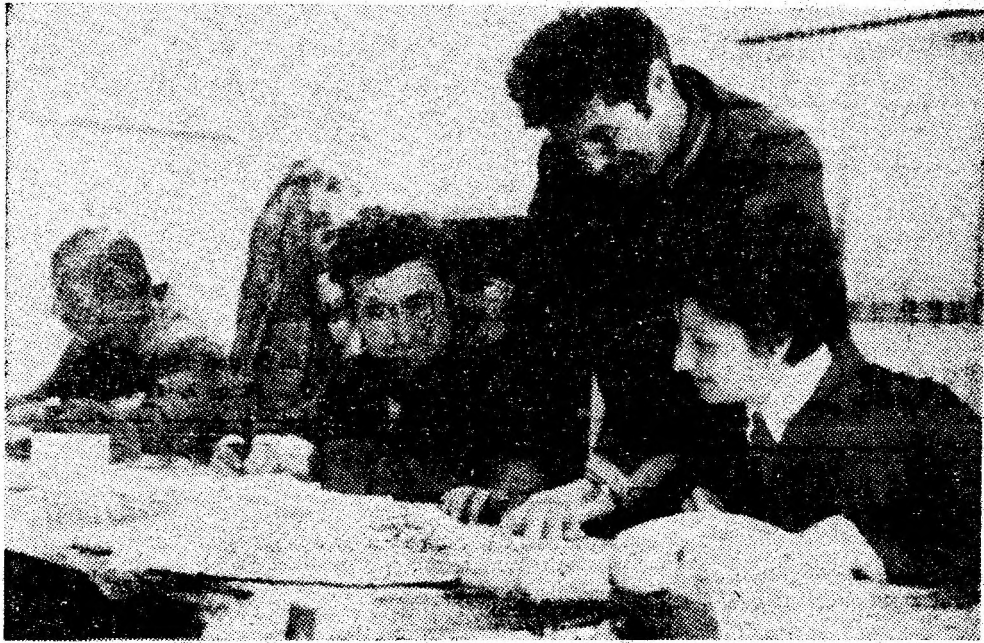
Până în prezent, la S.S.H. Vulcan s-au primit 120 de cereri pentru înscrierea individuală a oamenilor muncii în organizația proprie a F.U.S. Instantaneul nostru vă prezintă momentul centralizării cererilor.