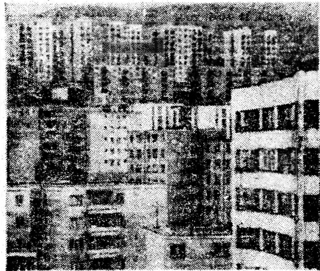
Vulcan. Trepte ale noului și confortului.

ce pot fi enumerate în acest context. Alte exemple găsim la minele Lupeni, Vulcan, Uricani, în cele două comune, în marile cartiere Aeroport, Coroești, 8 Martie, Viscoza. Un bilanț pe municipiu ne indică faptul că pînă ieri în Valea Jiului au fost constituite 200 de organizații proprii ale Frontului Unității Socialiste în întreprinderi, instituții, cartiere, totalizînd peste 15.000 membri. Măsurile propuse de secretarul general al partidului, tovarășul Nicolae Ceaușescu, cu privire la creșterea rolului Frontului Unității Socialiste au fost primite cu o largă adeziune în rîndul tuturor categoriilor de oameni ai muncii și cetățeni din municipiu, hotărâți să-și intensifice participarea la viața economică și social-culturală a întreprinderilor, la acțiunile obștești, patriotice organizate la locurile de muncă și în localități. (I.M.)