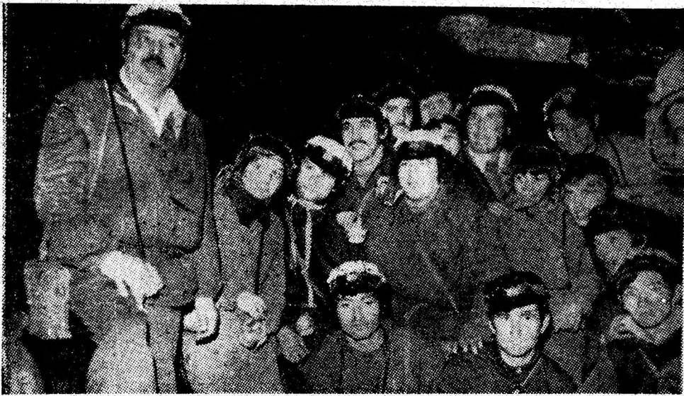
Intr-unul din abatajele mecanizate ale minei Lupoaia studenții urmăresc cu atenție explicațiile privind dispunerea utilajelor în frontul de lucru.