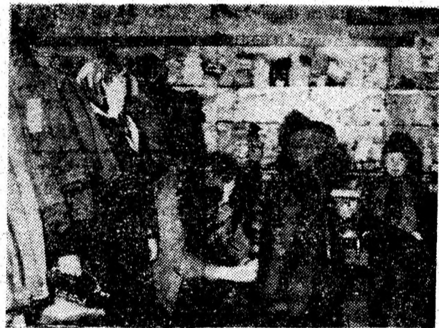
Instantaneu de sezon în magazinul „Trei pitici” din Lupeni. Magazinul oferă celor mici confecții și tricotațe menite să satisfacă toate preferințele.