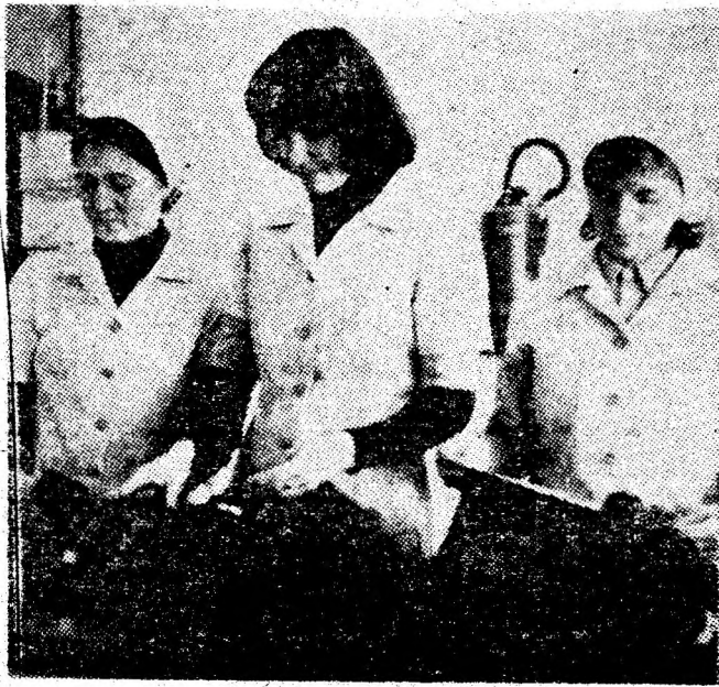
La secția C.T.C. a Fabricii de confecții Vulcan, se execută controlul de calitate a produselor fabricate.