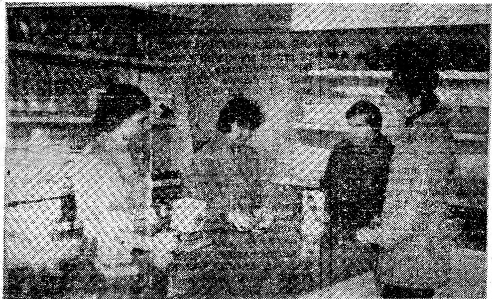
Aspect din interiorul modernului magazin de desfacere a produselor electrocasnice, deschis la parterul blocului 1-M din orașul Vulcan.

PETRU OCHIȘ, Petrila: În conformitate cu precizările privind aplicarea Legii nr. 3/1977, pot cere pensionarea persoanele care au lucrat în grupa I de muncă 17 ani și 4 luni și au vîrsta de 55 de ani impliniți. După cum ne informați, dv veți avea în 1980 vîrsta de 53 de ani