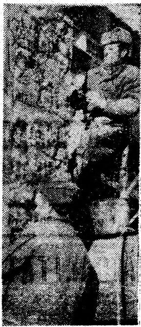
La lucru, dulgheri din brigada lui Gheorghe Neagoe de pe șantierul centrului civic al Petroșaniului.