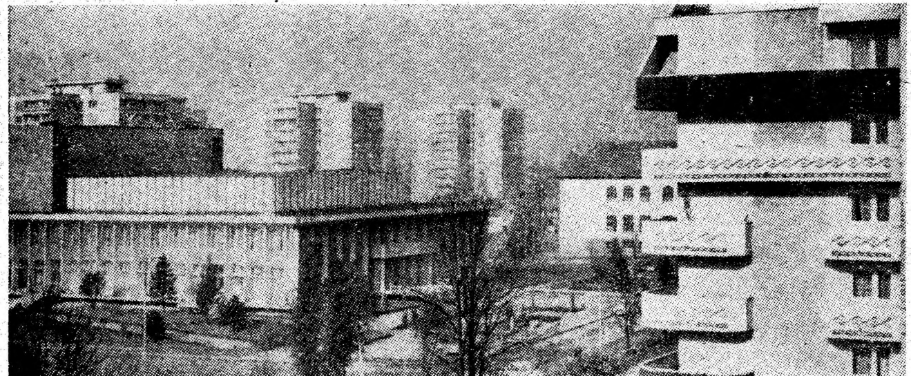
Centrul Petrosaniului innoit in pragul cumpenei dintre ani.