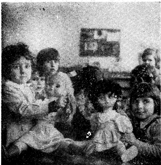
Instantaneu din noua grădiniță nr. 5 cu orar prelungit din orașul Lupeni, dată în acest an în folosință.

Aflu că întîlnirea cu tehnica nouă a fost adesea dificilă. Cînd a pornit complexul, în noiembrie, brigada Matyus raporta în plus doar 338 tone. Ex-