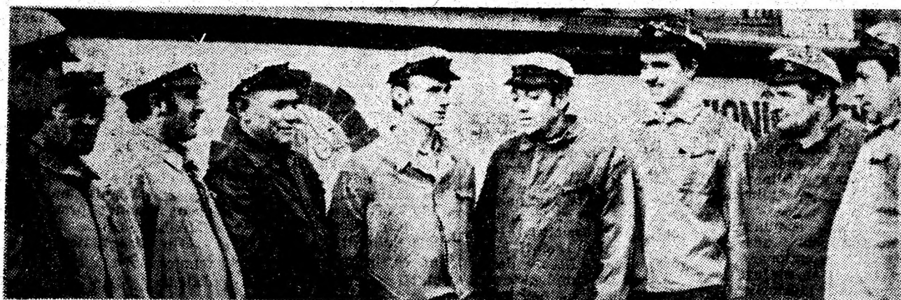
Cititorii mecanizării de la sectorul IV al minei Lupeni.