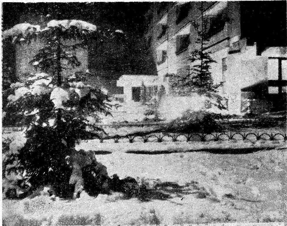
Petroșani — rapsodie nocturnă de iarnă.