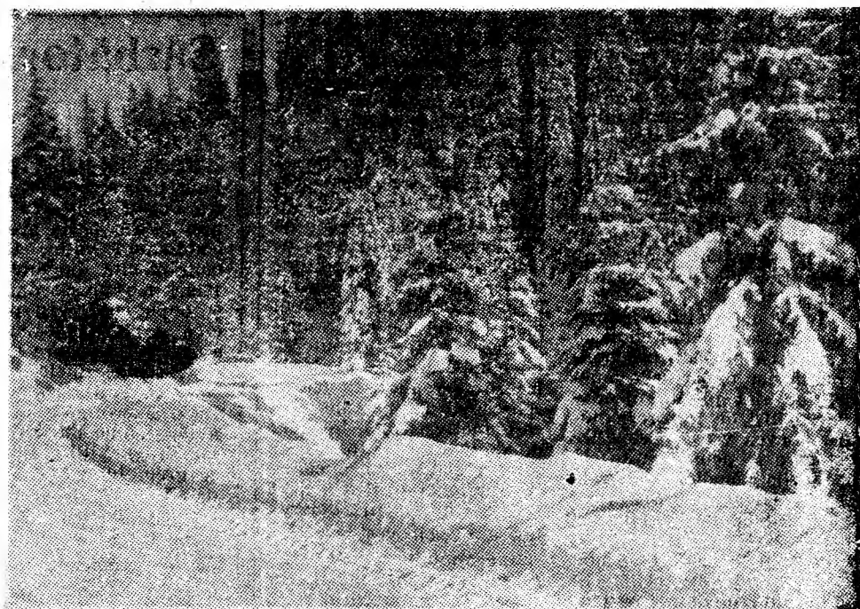
Feerie în munți.