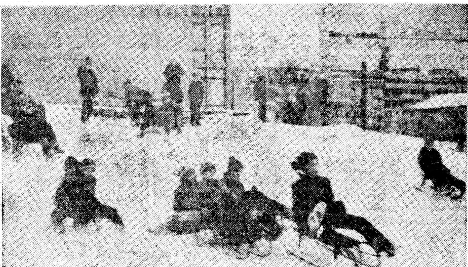
Vacanța cu bucuriile iernii.

Petroșani; învățători — la Școala generală nr. 1 Petroșani; educatoare (cămîne) — Căminul nr. 2 Petroșani și (grădiniște) — căminele nr. 9 Petroșani și nr. 6 Vulcan; maistri-instrucători — la Liceul industrial Petroșani, pentru maistri-instrucători femeii cercul pedagogic are loc astăzi la Școala generală nr. 5 Petroșani.