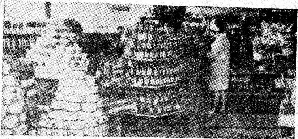
Aspect din cadrul complexului alimentar nr. 58 din Vulcan, de curînd redeschis, extins și reamenajat, oferind cumpărătorilor un volum sporit de mărfuri.