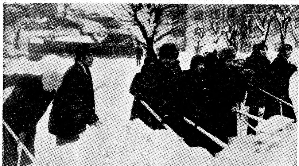
Numerosi oameni ai muncii din orașul Lupeni au participat intens la acțiunile de dezăpezire a arterelor de circulație. În foto: un grup de cetățeni acționând în cartierul „Vis coza” la degajarea străzii.