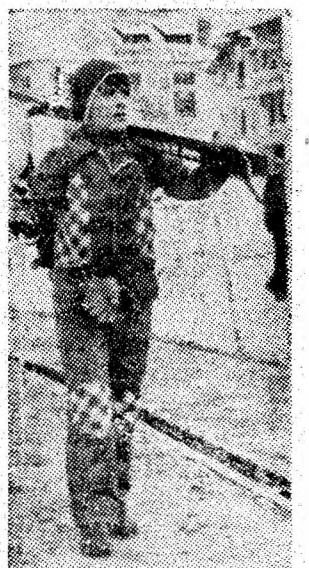
De la concurs, spre casă.