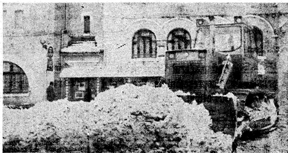
La Lupeni ca urmare a unei largi mobilizări și participări a cetățenilor, zăpada a fost curățită cu promptitudine. Descongestionarea străzilor de zăpadă continuă...