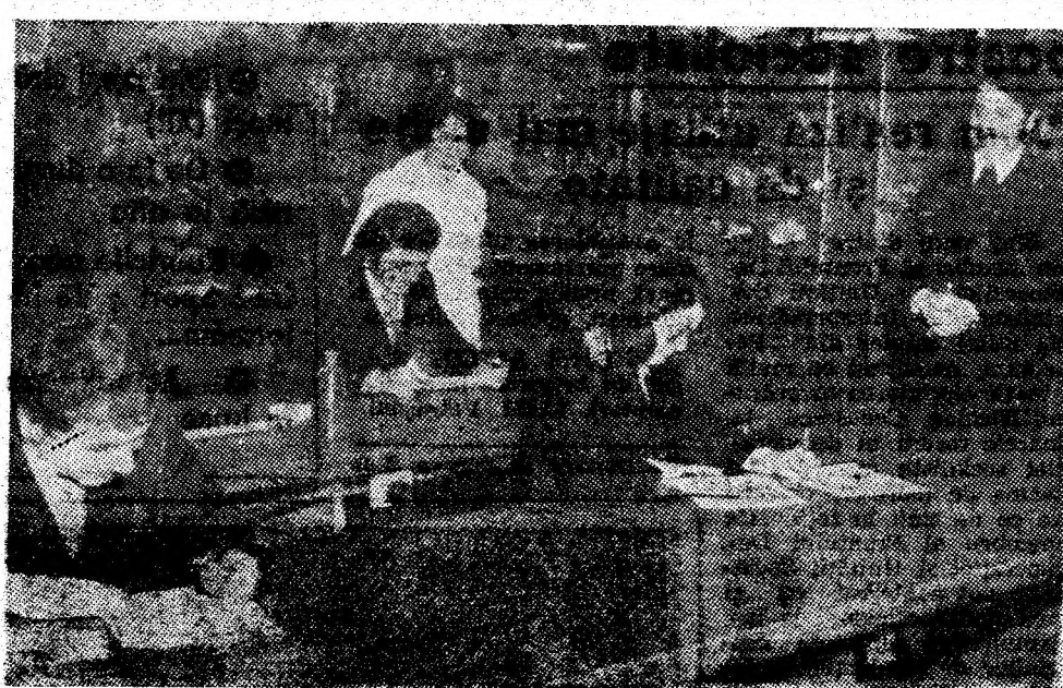
Un ultim instantaneu din timpul sesiunii de iarnă a examenelor la facultatea de mine. Examen la laboratorul de geologie.

Ținînd cont de sarcinile ce ne revin, mă voi ocupa cu și mai multă responsabilitate de creșterea cadrelor, pentru a le asigura o înaltă calificare.