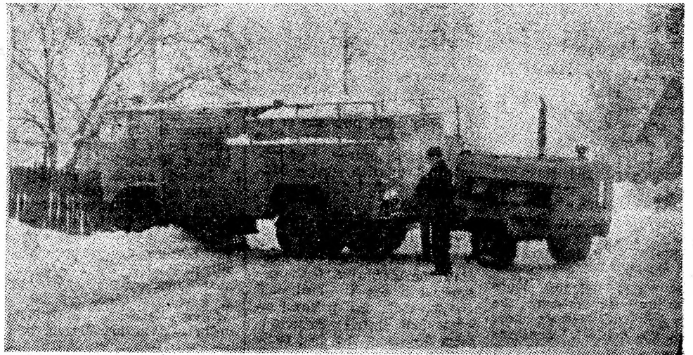
Blocaj la intrarea în Vulcan.