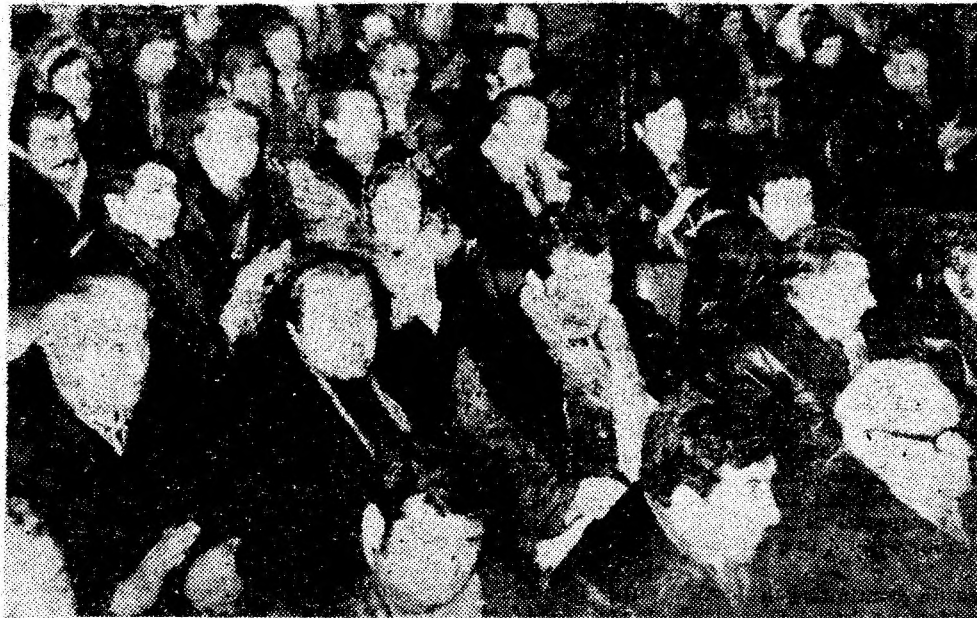
Cetățenii își exprimă în unanimitate adeziunea la propunerile de candidați.