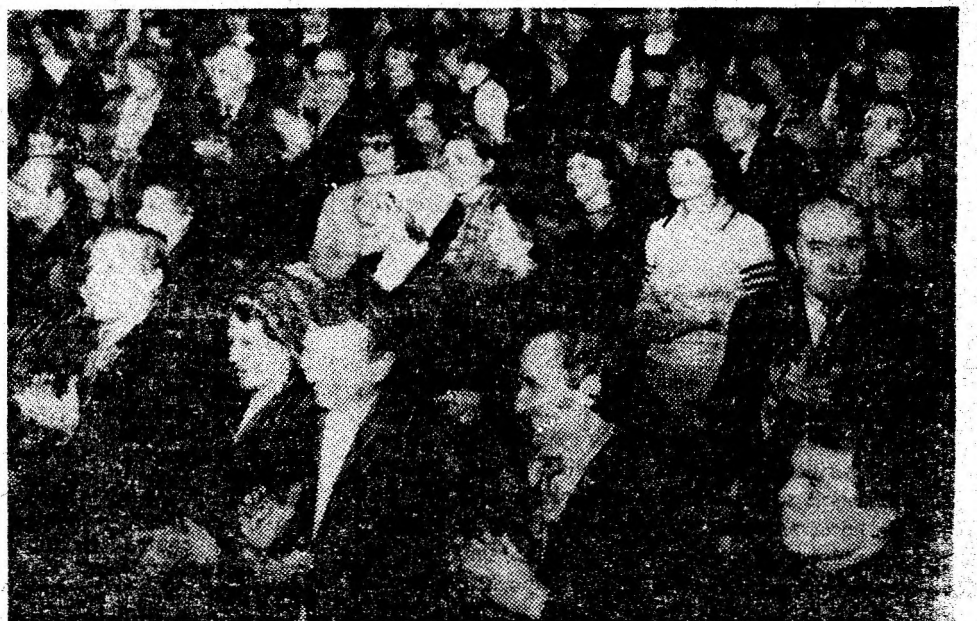
Participanții la adunarea cetățenească aprobă cu căldură candidatura propusă.

Valea Jiului 1980 peste 11 milioane tone de cărbune!