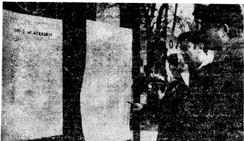
Cetățenii Văii Jiului iau cunoștință, prin intermediul publicațiilor orășenești, despre delimitarea circumscriptiilor electorale.