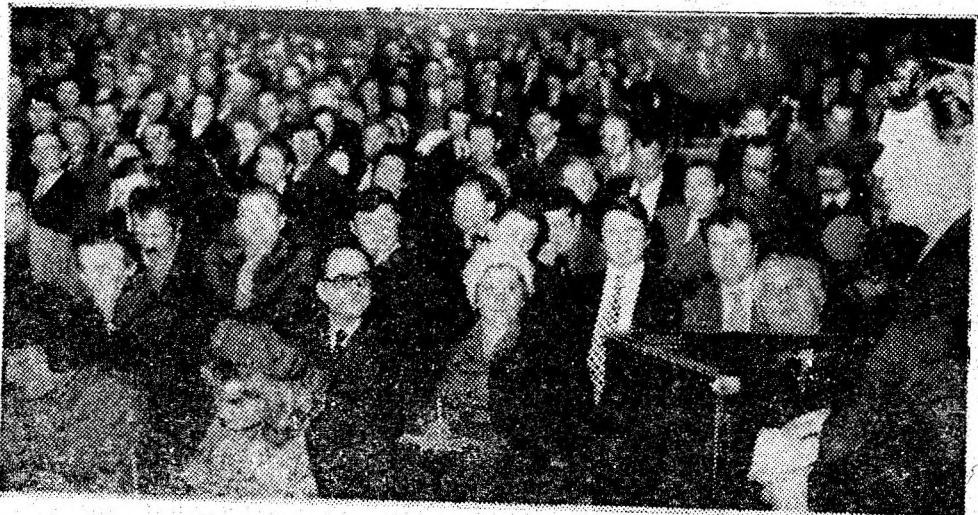
Aspect din timpul dezbaterilor adunării.

Consiliul oamenilor muncii își exprimă convingerea că personalul muncitor din unitățile combinatului, toți lucrătorii din adîncuri și de la suprafață, însufleții de obiectivele mărețe ale politicii interne și externe a partidului, de chemările adresate minerilor de către tovarășul Nicolae Ceaușescu, vor munci cu dăruire și abnegație, sub conducerea organizațiilor de partid pentru a obține în acest an decisiv al cincinalului realizări remarcabile în sporirea producției de cărbune.