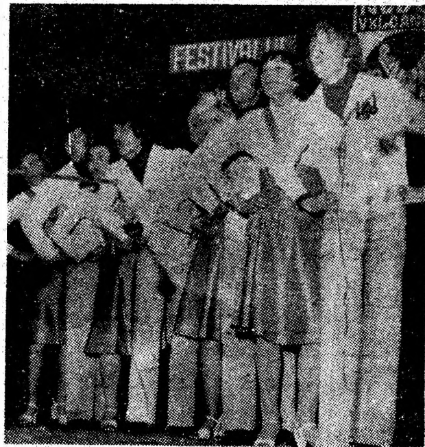
Evo'nează brigada artistică a I.M. Vulcan — laureată a Festivalului Național „Cîntarea României”.