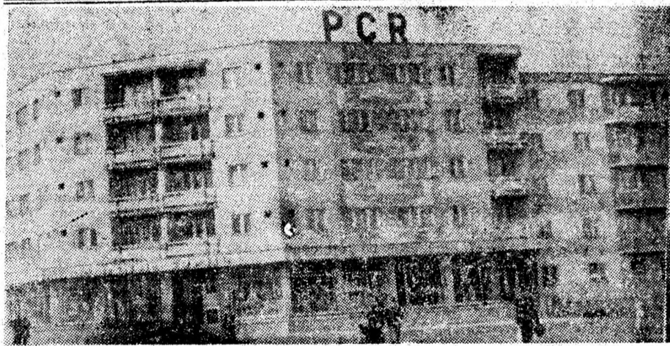
VULCAN — un oraș în care descoperi tinerețea și noul la fiecare pas.