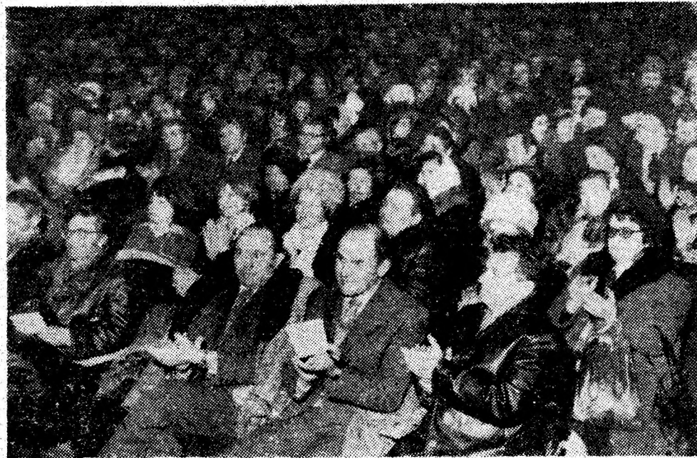
Aspect din timpul desășurării adunării cetățenești de la Petroșani.