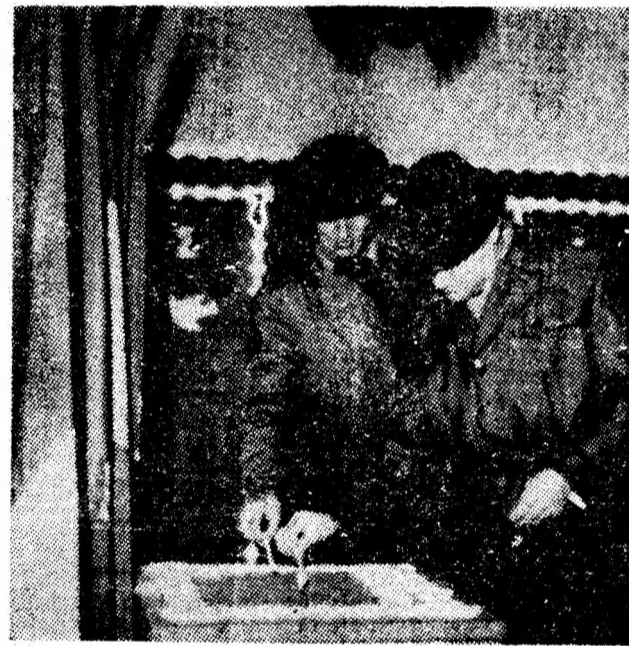
Locuitorii cartierului Aeroport — Petroșani își dau din inimă votul pentru deputații lor.

De menționat este faptul că, în toate secțiile de votare, formațiile artistice de amatori din localitate au prezentat frumoase programe culturale-artistice. (C.G.)