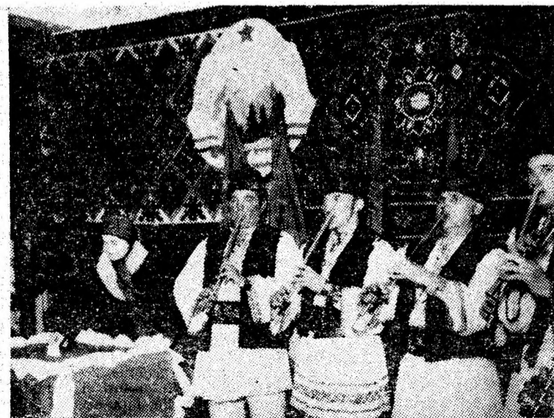
Fluierașii din Dealu Babii, prezenți în atmosfera sărbătorească străbătută de voia bună.