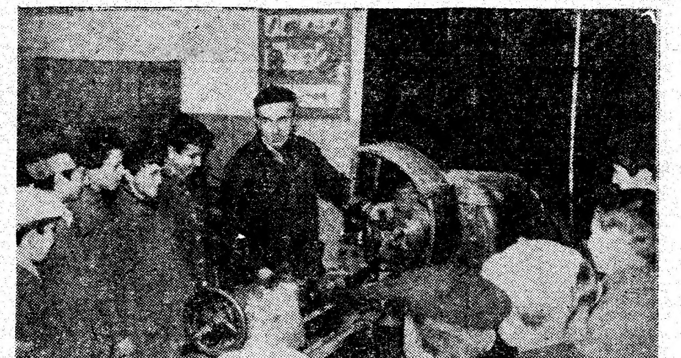
Practica în producție este una din activitățile importante pentru pregătirea viitoarelor cadre.

prima punctele de vedere cu privire la aportul cuceririlor științifice la sporirea producției de cărbune și îmbunătățirea condițiilor de muncă din subteran, membrii ai comisiei de organizare și productivitate a muncii a consiliului oamenilor muncii, mineri șefi de formații de lucru, maiștri și ingineri. (I.V.)