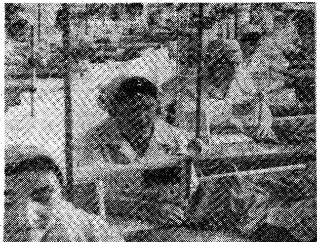
La locurile lor de muncă, din întreprinderea de confecții Vulcan — soții și fiice ale minerilor.