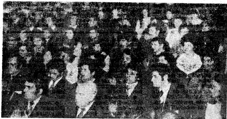
Aspect din timpul conferinței organizației municipale a U.T.C.