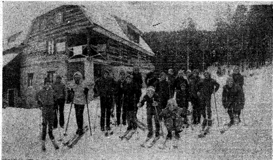
Cabana „Straja” cunoaște în fiecare duminică un mare aflux de oameni care au îndrăgit sporturile montane.

Fiecare disciplină didactică folosește forme proprii de integrare a materiei respective în ansamblul general de cerințe. În ceea ce mă privește, ca profesor de educație fizică, am datoria, pornind de la necesitatea cunoașterii de către elevi a cerințelor și obiectivelor generale ce stau în fața pregătirii lor școlare, să-i fac să înțeleagă mai bine și importanța pregătirii lor fizice, pe linia unei reale pregătiri multilaterale. Educația fizică asigură, în cea mai mare