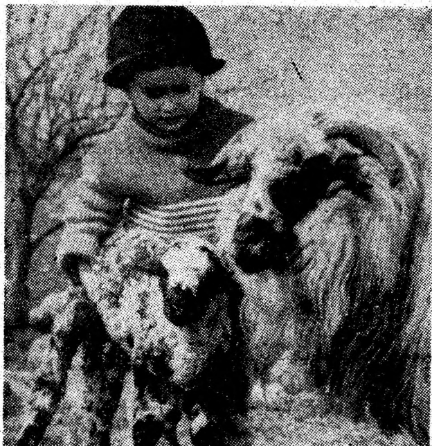
Și totuși vine primăvara...