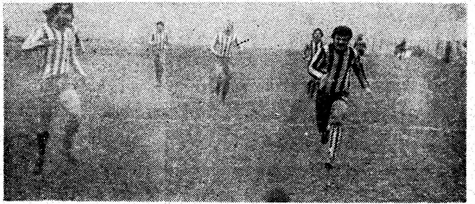
Minerul Vulcan — o echipă de la care suporterii săi așteaptă mai mult în activitatea competițională viitoare.