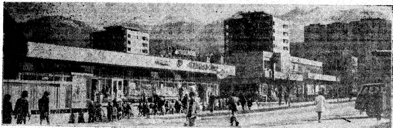
Amprantă a noului pe vechiul meleag al Văii Jiului.