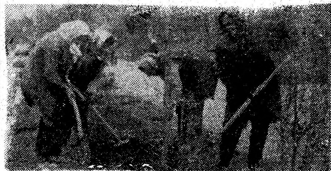
„Ajutoarele” primăverii la... lucru.

Începînd de astăzi, Institutul de mine din Petroșani organizează, în fiecare duminică, cursuri de pregătire pentru candidații la concursul de admitere — cursuri serale ingineri. Astfel de cursuri și consultații care vin în sprijinul desăvîrșirii pregătirii tuturor tinerilor din Valea Jiului, care vor să-și continue studiile superioare miniere, vor avea loc și joia, desfășurîndu-se, cu participarea cadrelor didactice de la Institutul de mine și din licee, la Uricani (în localul școlii generale), Lupeni (Liceul industrial nr. 1), Vulcan (la Liceul industrial), Petroșani (la Liceul de matematică-fizică) și Petrila (la Liceul industrial) și vor continua pînă la începerea concursului de admitere.