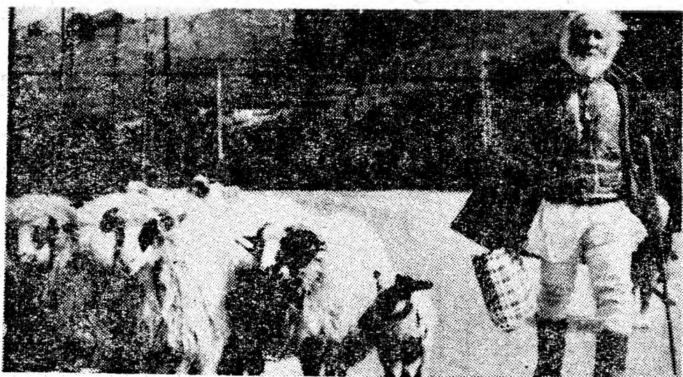
A venit, totuși, primăvara.