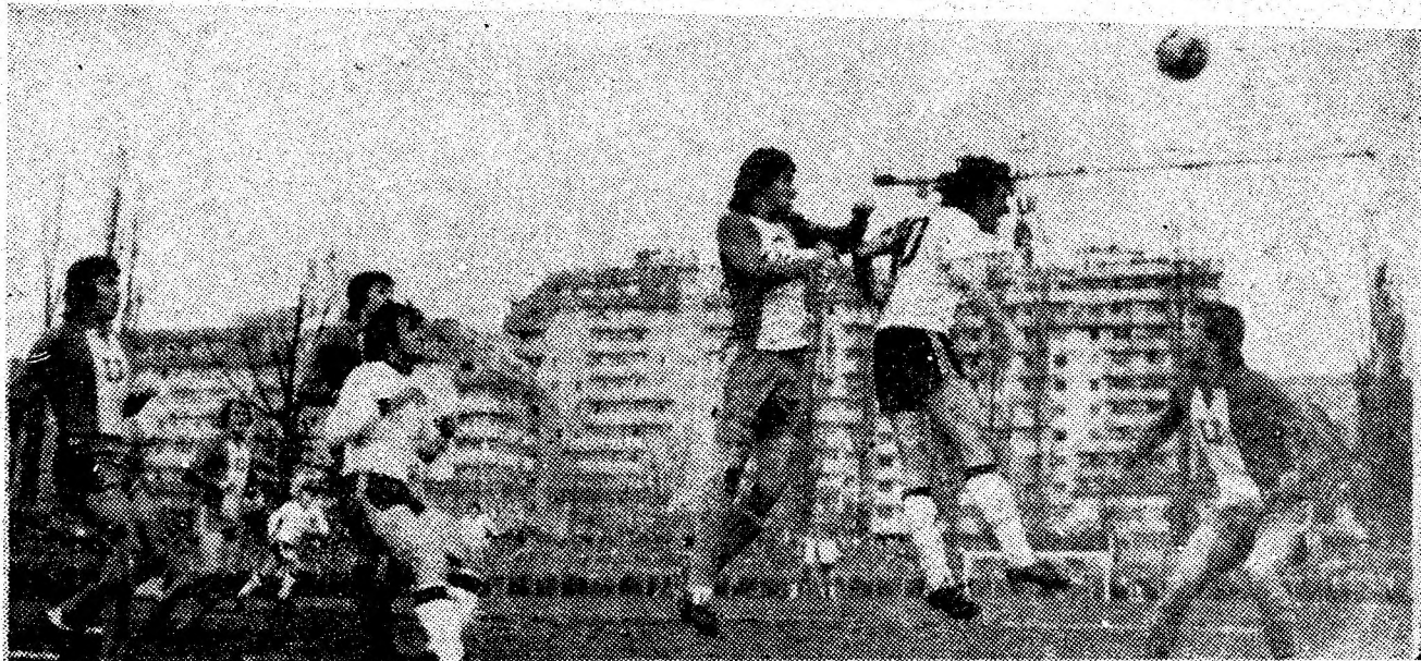
Spektacol... gratuit în fața porții craiovene și a celor 20.000 de spectatori.