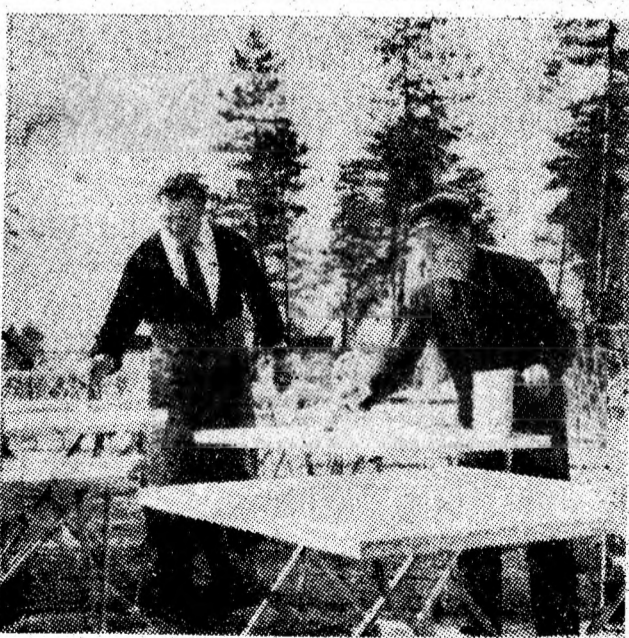
La „Brădet” lucrătorii cabanei-restaurant dau culori noi meselor de pe terasa care în curînd își va aștepta oaspeții.