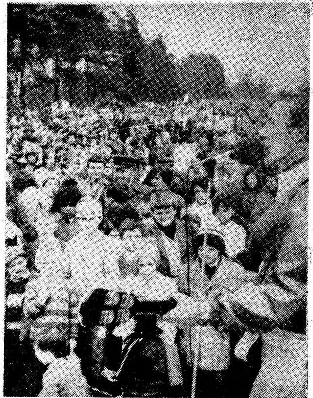
La „Brădet”, cîntec și voie bună.

Sub cerul primăvara-tec, aceste trăsături ale omului care trăiește și muncește aici, în Valea Jiului, în aceste zile frumoase în sine și minunate în complexitatea lor umană.