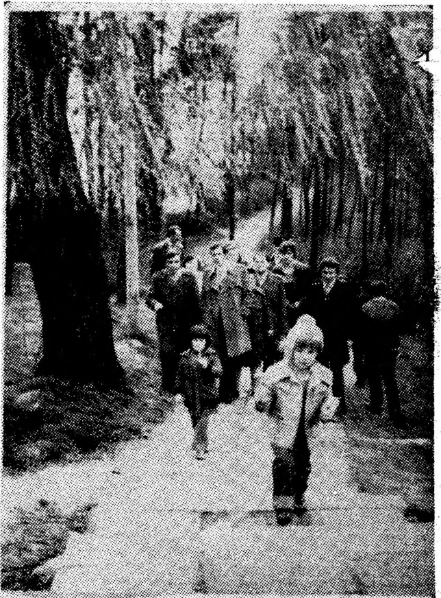
Pe aleile inverzite.