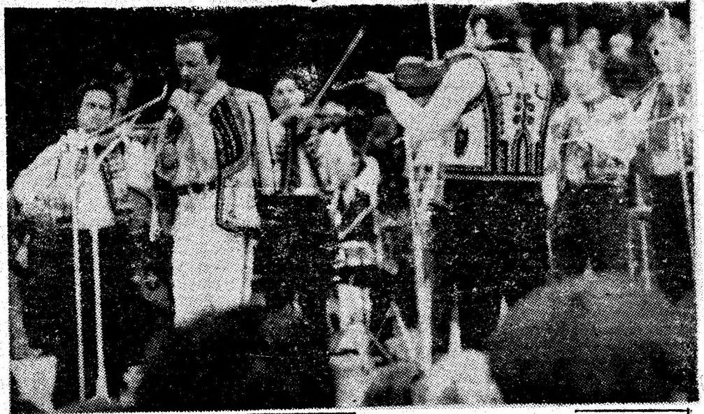
Formația de muzică populară a clubului Vulcan a încântat miile de oameni ai muncii veniți la „Brazil”.