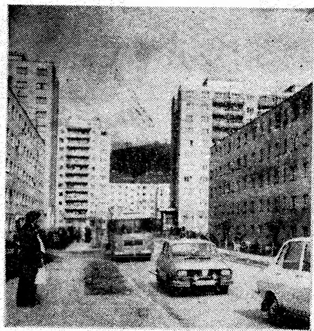
Prin cartierul Aeroport — Petroșani.