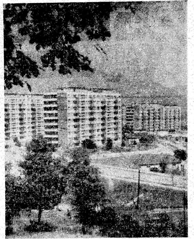
Vulcanul zilelor noastre. În acest întinerit oraș al minerilor, frumusețelor naturii li se adaugă an de an frumuseți edilitare, făurite de mina omului, pentru om.

Pe șantierul din Petrița din cele 221 de apartamente planificate pentru 1980, nu a fost predat nici un apartament. Constructorul promite însă că vor fi date în folosință la termen apartamentele din blocul 55 H, unde sînt concentrate principalele forțe existente. E bine dacă se respectă termenul de predare. Nu trebuie neglijate însă nici celelalte puncte de lucru. La blocul 53 se cer „urgentele” lucrările de montare a căii de rulare și autorizarea macaralei. Fiindcă, altfel, rămîne sub semnul întrebării predarea la termen a apartamentelor din blocul 53.