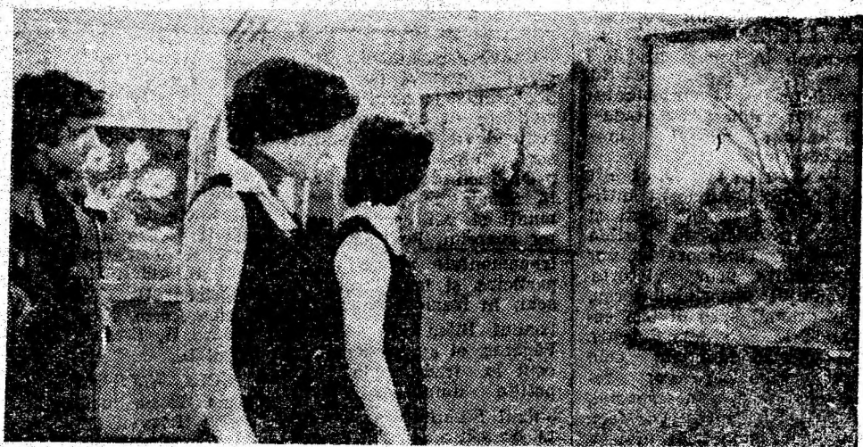
Instantaneu din expoziția talentatei pictorițe