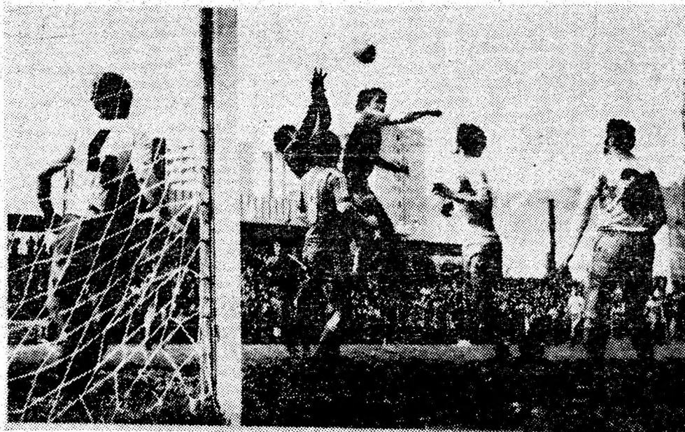
Una din multele ocazii de a înscrie măcar golul de onoare al ultimului meci din acest campionat. Dar...