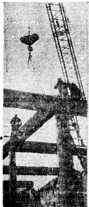
Se montează grinzile viitoare tipografiei din Petroșani.