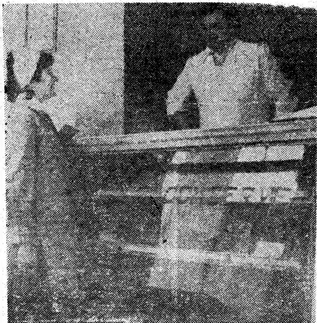
Deschis recent, la Vulcan magazinul profilat pe vînzarea cîrnii, subproduselor din carne, a conservei și altor preparate, se bucură de o bună apreciere din partea cumpărătorilor.