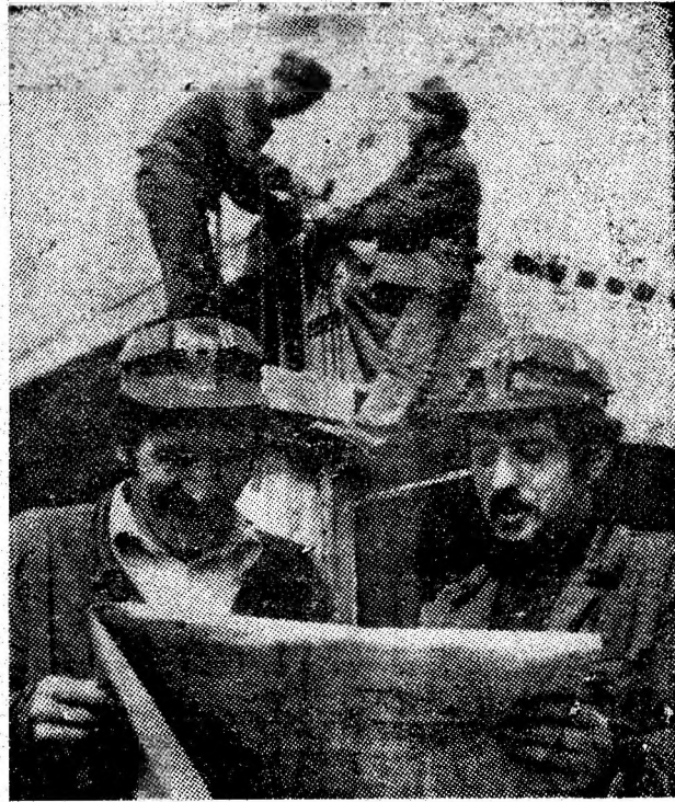
Viitorul ansamblu de câmine pentru nefamiliști din Vulcan. In foto: un grup de constructori de la șantierul nr. 3 al I.C.M.M.