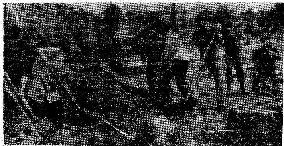
În plină activitate o parte din grupul de participanți de la Institutul de mine Petroșani, la realizarea termoficării.