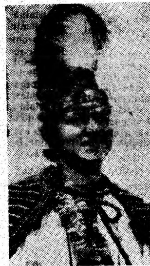
cuvînt al cîntecului maramureșean?

— Mulți dintre cei care vă admiră se întreabă de ce rămîneți consecvent purtător de